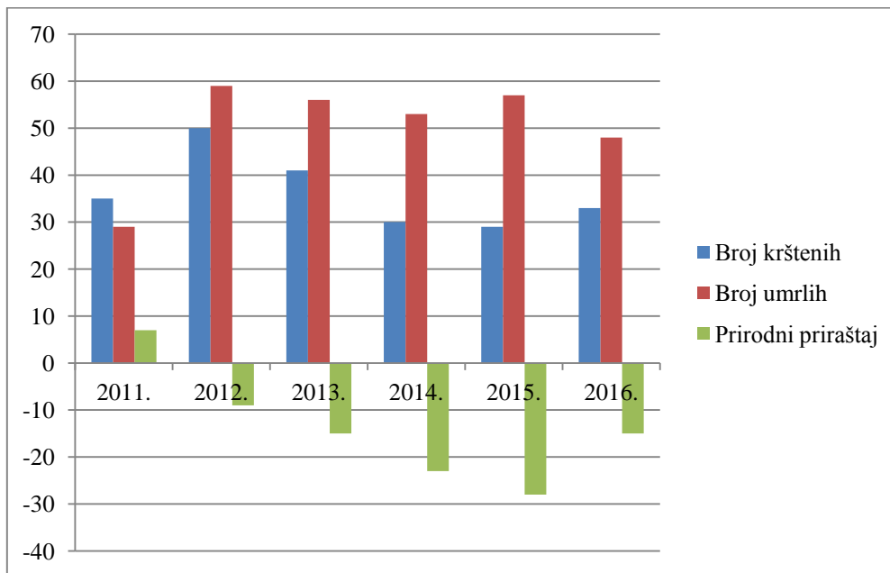
Grafikon 3. Prirodni priraštaj župe sv. Petra i Pavla – Kašina (2011. – 2016.)